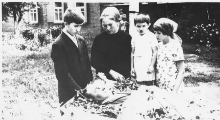
ДЕТИ у гроба П.Ф.

Я вспоминаю о семье О детках дорогих За них взываю я к Тебе За плач их и других. О, Боже, не покинь встречу всем скорей.